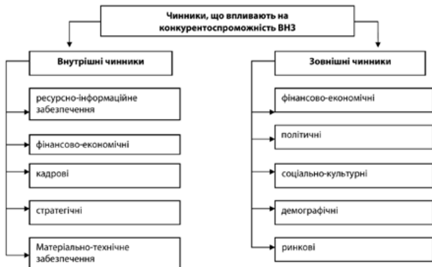
Рис. 2. Системні чинники, що впливають на конкурентоспроможність вищого навчального закладу

но-технічний потенціал, маркетингову та стратегічну політику, людський капітал, імідж ВНЗ.